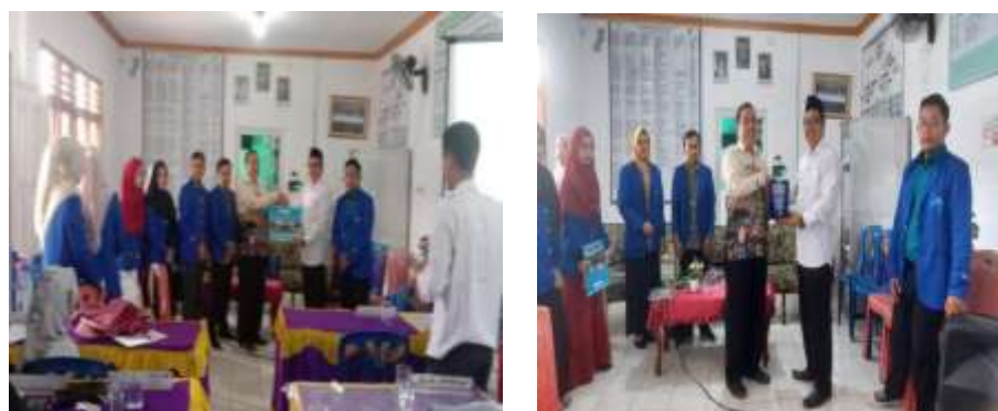
Gambar 2. Penyerahan piagam dan kalender kepada kepala Madrasah

Kegiatan PKM ini melibatkan 50 orang yang terdiri dari kepala sekolah dan guru. Kegiatan dilaksanakan dalam tiga tahap yaitu, tahap perencanaan kegiatan PKM, tahap pelaksanaan serta tahap monitoring dan evaluasi. Kegiatan sosialisasi dilaksanakan tanggal 20 Februari 2023 secara luring di Madrasah Aliyah (MA) Muhajirin Tugumulyo Musi Rawas, kegiatan ini dihadiri oleh kepala Prodi dan 13 mahasiswa dari Magister Manajemen Pendidikan Islam yang terlibat dalam kegiatan PKM ini. Kegiatan sosialisasi diawali oleh penyampaian jenis kegiatan, tujuan, bentuk pelatihan yang akan dilakukan serta tindak lanjut dari PKM. Diskusi dilakukan antara peserta dengan narasumber dan tim pkm. Setelah diskusi selesai tim pkm menyampaikan rencana tindak lanjut dari kegiatan pelatihan ini dengan tema tantangan dan strategi pembelajaran merdeka belajar di era digital. Penyampaian materi disampaikan dengan sesederhana mungkin namun selengkap mungkin materinya, dikarenakan para peserta adalah orang-orang yang menjadi garda terdepan pelaksanaan kurikulum merdeka di sekolah ialah kepala sekolah dan guru. Penyampaian materi selesai, narasumber memberikan kesempatan kepada peserta untuk melakukan proses tanya jawab.