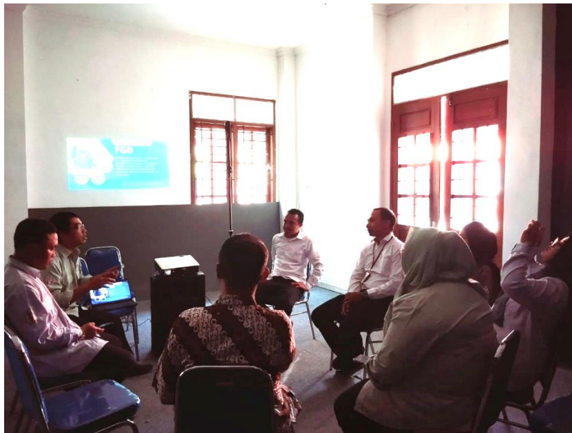
Gambar 1: Kegiatan FGD dengan Mitra dan Narasumber

1. Kegiatan pertama dimulai dengan forum diskusi grup tentang masalah dan kebutuhan mitra pengabdian tentang wisata warisan budaya yang ada di Malang. Ini dicapai melalui kegiatan presentasi materi oleh narasumber, diskusi, dan tanya jawab. Diskusi dengan narasumber yang diundang berlangsung dengan antusias, seperti yang ditunjukkan oleh tanya jawab antara mitra, pengabdian, dan narasumber yang diundang. Mitra menceritakan dengan baik pengalaman mereka selama bekerja di lapangan yang belum berbasis teknologi digital. Mereka menyatakan bahwa mereka masih menghadapi tantangan dalam pembuatan media promosi dan alat pendukungnya. Ini terutama berkaitan dengan sumber daya manusia anggota mitra pengabdian yang tidak semuanya memiliki kemampuan untuk membuat web dan aplikasi digital untuk mendukung operasi mereka. Ini menunjukkan bahwa diskusi berlangsung dengan lancar dan mitra aktif mengikutinya.