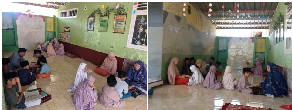
Gambar 2. Belajar Al-qur'an Metode Qiroati

Berdasarkan hasil observasi, dilihat dari kondisi tersebut maka kami melakukan kolaborasi dengan pemerintah setempat dan ustazah untuk melakukan kegiatan pendampingan. Hal ini bertujuan untuk meningkatkan kualitas baca Al-qur'an anak-anak di TPQ lumbung Tahfiz Syekh Abdussatar. Adapun metode yang digunakan dalam pendampingan tersebut yaitu metode qiroati. Metode Qiroati merupakan metode pengajaran membaca al-Qur'an dengan bunyi huruf-huruf hijaiyah yang sudah berharakat (tanda baca)(Farida et al., 2021). Kegiatan pendampingan dilakukan selama 5 (lima) minggu dimulai pada tanggal 20 juli - 24 Agustus 2024.