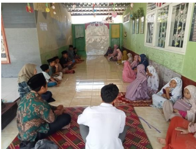
Gambar 3. Evaluasi program Pendampingan

Untuk mengetahui keberhasilan dalam pelaksanaan pengabdian kepada masyarakat, kami melakukan evaluasi dengan cara memberikan kesempatan kepada beberapa peserta didik untuk membaca Al-qur'an dan kami menyimak atau mendengarkan sesuai dengan metode qiroati. Berdasarkan hasil evaluasi, pada kegiatan pendampingan dalam meningkatkan baca Al-Qur'an dengan metode qiroati, hampir semua peserta didik yang membaca Al-Qur'an memiliki kualitas baca al-qur'an yang baik dan lancar sesuai dengan kaidah-kaidah tajwid.