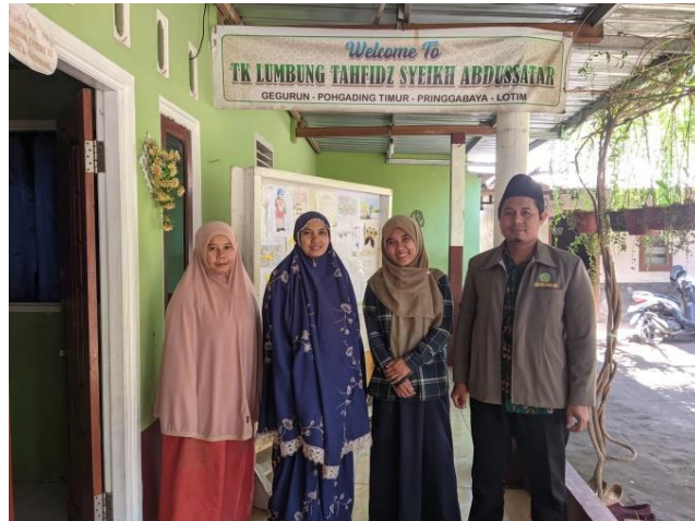
Gambar 1. Foto bersama Pemimpin TPQ setelah wawancara

maksimal karena dilakukan sendirian untuk mengajar anak –anak yang jumlahnya kurang lebih 30 orang.