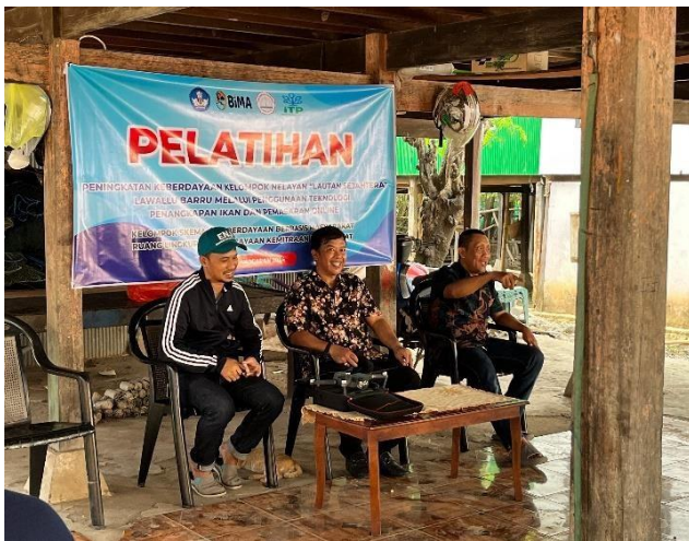
Gambar 1. Penyuluhan penggunaan Flying Drone

Teknologi yang diperkenalkan dalam kegiatan penyuluhan adalah penggunaan flying drone yang iintegrasikan dengan fish finder untuk mendeteksi titik konsentrasi ikan. Drone yang digunakan untuk pelatihan peserta adalah drone FIMI X8SE 2022 yang dapat terbang Sekitar 35 menit dengan kecepatan konstan 8m/s. drone ini dilengkapi Kamera Sony 1/2 inch dengan CMOS Sensor yang mendukung hingga 48MP dilengkapi dengan perangkat GPS. Pada kegiatan ini dihadiri oleh 15 orang anggota kelompok nelayan.