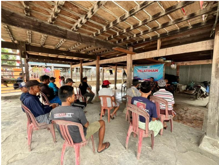
Gambar 2. Pelatihan penghitungan es dan pemasaran online