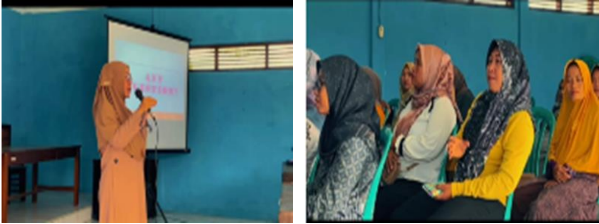
Gambar 3. Penyampaian materi PKM dan sesi tanya jawab

Penyampaian materi disampaikan dengan metode ceramah menggunakan power point. Kemudian dilakukan tanya jawab. Hal ini dilakukan untuk memberikan waktu pada peserta menanyakan hal-hal yang belum dipahami atas materi yang telah disampaikan. Diskusi dan tanya jawab berlangsung sangat baik, ditandai dengan aktifnya peserta dalam bertanya dan sharing pengalaman mereka ketika menggunakan obat. Kemudian dilanjutkan dengan Post test .