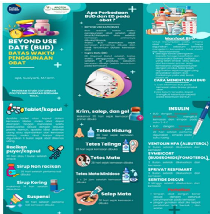
Gambar 2. Leaflet Beyond Use Date beberapa bentuk sediaan obat

Untuk lebih memudahkan dalam memahami tentang BUD dan ED kami membagikan leaflet kepada peserta. Leaflet berisi tentang BUD secara umum, disertai dengan contoh-contoh gambar bentuk sediaan obat. Media leaflet kami gunakan sebagai salah satu alat bantu dalam memberikan edukasi karena praktis, mudah dibawa kemana saja dan dapat dibaca kapan saja (Putri, K. D., Semiarty, R., & Linosefa, 2020). Leaflet juga dibuat semenarik mungkin dengan desain yang dilengkapi gambar agar minat literasi responden lebih tinggi (Angginingrum et al., 2023).