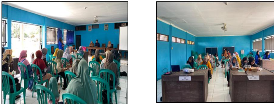
Gambar 1. Pembukaan kegiatan PKM dan Sesi pretest

berisi definisi BUD secara umum dan perbedaannya dengan tanggal kadaluarsa, manfaat BUD, dan cara menentukan BUD untuk masing-masing bentuk sediaan obat.