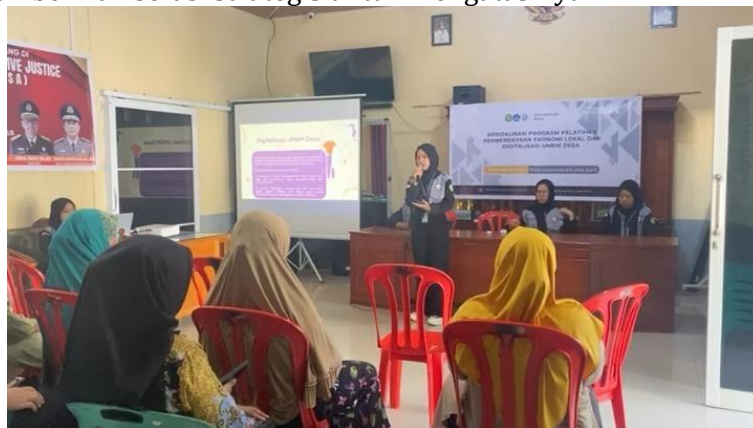
Gambar 3. Sosialisasi Pemberdayaan Ekonomi Lokal dan Digitalisasi UMKM Desa

Pada kegiatan sosialisasi tersebut, Tim Pengabdian memaparkan materi mengenai manfaat digitalisasi bagi UMKM, teknik pemasaran produk secara online, serta penggunaan media sosial sebagai alat promosi. Kami juga membahas tantangan yang dihadapi UMKM dalam proses digitalisasi serta memberikan solusi strategis untuk mengatasinya.