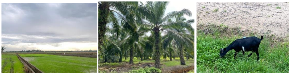
Gambar 2. Potensi Desa Sepotong

Batas Wilayah Desa Sepotong, Desa Sepotong berbatasan dengan Desa Koto di sebelah utara, Desa Langkat di sebelah selatan, Desa Lubuk Gaung di sebelah barat, dan Desa Laksamana serta Sungai Guntung di timur. Secara topografis, desa ini tidak rentan terhadap erosi karena aliran permukaan air yang lambat, sehingga sangat cocok untuk pertanian dan kehutanan. Namun, pengembangan irigasi lahan basah dapat lebih menantang akibat kemiringan yang rendah. Tanah di desa ini didominasi oleh tanah gambut, dengan ketebalan hingga lebih dari 215 cm, serta tanah liat dan lempung di sepanjang sungai. Desa ini juga dialiri oleh Sungai Siak Kecil yang menyediakan sumber air, meskipun kualitasnya rendah akibat kandungan gambut.