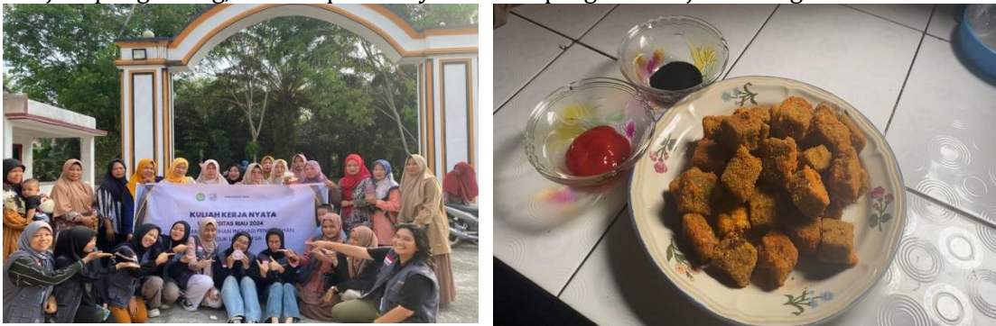
(a) (b) Gambar 5 (a) Pelatihan,Praktek Langsung Pembuatan Nugget Dari Tutut; (b) Hasil Nugget dari Olahan Tutut

Tutut adalah sumber daya alam yang melimpah di desa ini, namun sering kali dianggap sebagai bahan pangan yang kurang bernilai. Melalui pelatihan ini, masyarakat diajak untuk melihat potensi Tutut sebagai bahan baku inovatif yang dapat diolah menjadi produk bernilai tinggi, yaitu nugget. Di Desa Sepotong ini masyarakatnya jarang mengonsumsi tutut, jadi kendala awal dalam sosialisasi maupun pelatihan adalah reaksi maupun respon masyarakat terhadap tutut ini. Namun ini tidak menjadi penghalang, kami dapat menyelesaikan program kerja ini dengan baik dan lancar.