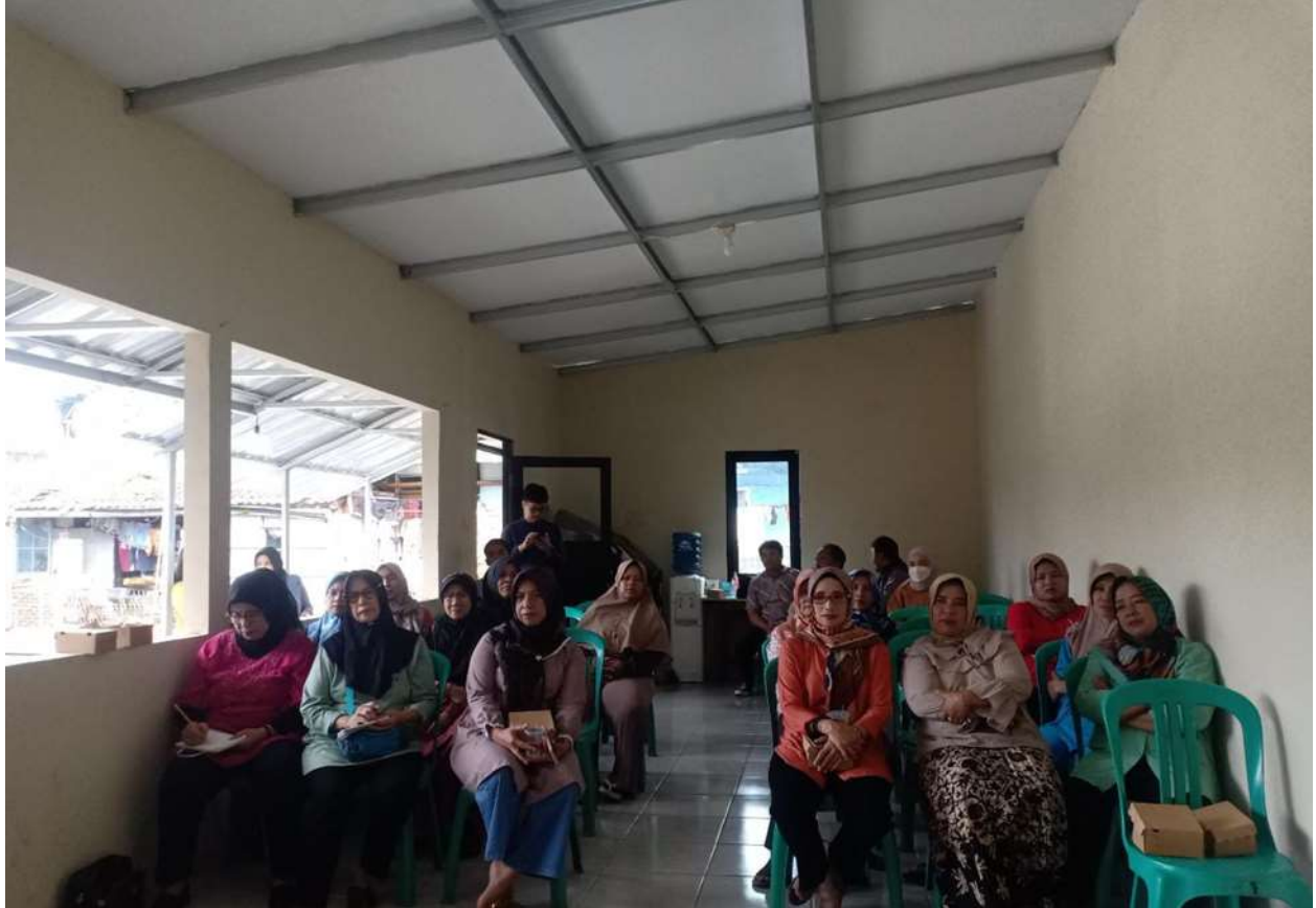
Gambar 2. Para pelaku UMKM dari lingkungan RW 10 Sukamaju Cibeunying Kidul

Hal-hal yang disampaikan oleh narasumber kepada para peserta dari UMKM lingkungan RW 10 Sukamaju adalah agar dapat membuat suatu strategi Pemasaran yang tepat dengan mengetahui kondisi UMKM dan juga kondisi lingkungan sekitar sehingga dapat menghasilkan program seperti produk, promosi, harga dan saluran distribusi yang sesuai dengan kebutuhan pasar sehingga dengan strategi Pemasaran yang tepat UMKM bisa mencapai tujuannya seperti keuntungan dan pengembangan usaha UMKM. Sesi tukar pendapat dijadikan sarana para peserta lebih paham dikerenakan menghubungkan dengan permasalahan yang nyata dari UMKM tersebut.