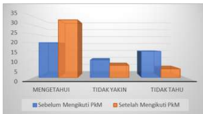
Gambar 4. Hasil pengolahan SPSS Tingkat perbandingan penyerapan wawasan sebelum dan setelah pelatihan

Berdasarkan angka pada gambar.2 dapat dilihat bahwa sebelum diadakan pelatihan pengabdian kepada masyarakat jumlahnya sedikit yang mengetahui pengertian akan strategi pemasaran, dengan porsi sebesar 35% atau berjumlah 14% selanjutnya 10% atau sejumlah 5 peserta pelatihan yang menyatakan ragu atau sudah mengetahui akan strategi pemasaran tersebut, dan terlihat total peserta UMKM yang belum mengetahui secara benar tentang Strategi pemasaran sebesar 35%