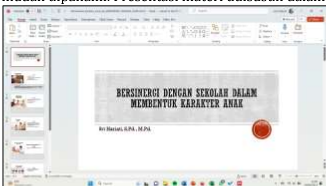
Gambar 3 Materi Presentasi