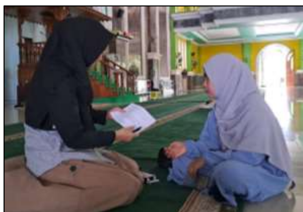
Gambar 5 Pembagian Angket Pretest

Berdasarkan hasil pre-test yang disajikan pada Tabel 1 diperoleh data bahwa besar persentase pengetahuan dan sikap peserta masih dibawah 50% yaitu sebesar 45% dan 48%. Ini menandakan Sebagian besar peserta masih memiliki pengetahuan dan sikap yang rendah tentang parenting dan pembentukan karakter anak di era Society 5.0. sedangkan untuk aspek keyakinan sebesar 53%, implementasi sebesar 67%, dan harapan/persepsi sebesar 69%