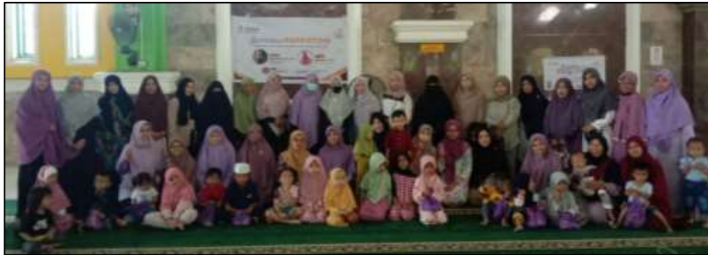
Gambar 9 Foto Bersama

Seluruh rangkaian kegiatan ini diakhiri dengan foto bersama seluruh tim, panitia terlibat dan peserta.