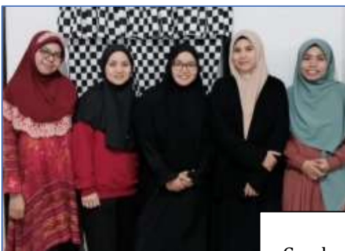
Gambar 1 Tim PKM yang Terbentuk