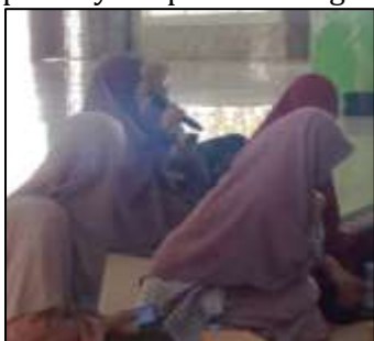
Gambar 7 Peserta Penanya