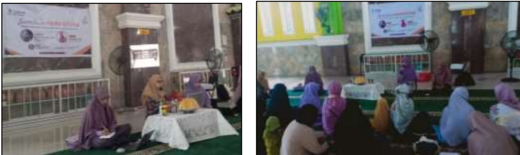
Gambar 6 Pemaparan Materi