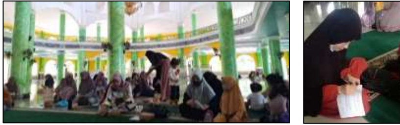
Gambar 8 Pembagian dan Pengisian Angket Post test

Seluruh rangkaian kegiatan ini diakhiri dengan foto bersama seluruh tim, panitia terlibat dan peserta.