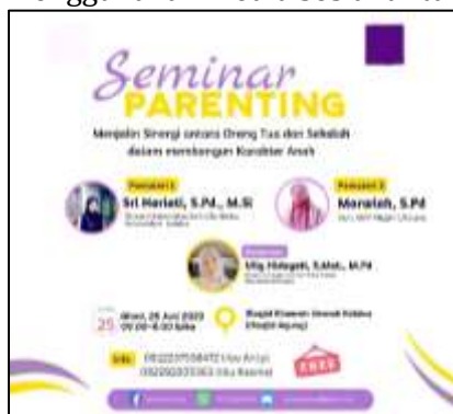
Gambar 4 Desain Poster untuk Sosialisasi di Media Sosial