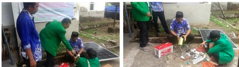
Gambar 6. Kegiatan demonstrasi perakitan panel surya yang dilakukan oleh mitra

Setelah pelaksanaan pelatihan selesai, dilanjutkan dengan tahapan evaluasi. Pada tahapan ini dilakukan pengukuran menggunakan instrumen angket untuk mengetahui keberhasilan penerapan panel surya dalam mendukung aktivitas pelayanan administrasi di kantor desa, serta untuk mengetahui tingkat pemahaman dan keterampilan aparatur desa dalam terhadap implementasi panel surya.