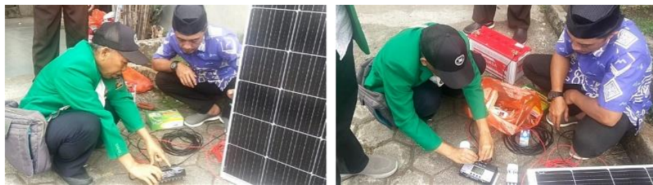
Gambar 5. Pemberian pengarah alat dan bahan panel surya

Selanjutnya, dilakukan kegiatan implementasi peralatan panel surya di lokasi Desa Borisallo. Kegiatan ini menggunakan metode partisipatif, tanya jawab dan demonstrasi, yang dihadiri aparatur desa yang ditunjuk oleh Kepala Desa Borisallo. Kegiatan yang berlangsung di lokasi penempatan panel surya, aparatur desa tersebut diberikan pengarah dan materi terkait alat dan bahan yang digunakan dalam membangun sistem panel surya yang akan diterapkan. Setelah melakukan pemberian materi dan pengarah, dilanjutkan dengan sesi tanya jawab. Setelah aparatur desa tersebut memahami sistem panel surya yang akan dipasang, dilanjutkan dengan tahapan demonstrasi. Pada tahapan ini, aparatur desa membuat rangkaian panel surya sesuai arahan yang diberikan oleh Tim PKM. Panel surya yang telah dirangkai menjadi satu sistem, ditempatkan pada titik lokasi yang telah disepakati antara mitra dan tim PKM. Uji coba panel surya di lokasi kegiatan, berhasil dengan baik. Berdasarkan hasil pantauan kegiatan, aparat desa telah memiliki pemahaman dan kemampuan dalam membuat sistem panel surya, untuk mendukung aktivitas pelayanan administrasi di kantor desa.