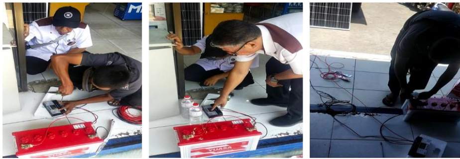
Gambar 4. Pelaksanaan uji coba panel surya

Selanjutnya, dilakukan kegiatan implementasi peralatan panel surya di lokasi Desa Borisallo. Kegiatan ini menggunakan metode partisipatif, tanya jawab dan demonstrasi, yang dihadiri aparatur desa yang ditunjuk oleh Kepala Desa Borisallo. Kegiatan yang berlangsung di lokasi penempatan panel surya, aparatur desa tersebut diberikan pengarah dan materi terkait alat dan bahan yang digunakan dalam membangun sistem panel surya yang akan diterapkan. Setelah melakukan pemberian materi dan pengarah, dilanjutkan dengan sesi tanya jawab. Setelah aparatur desa tersebut memahami sistem panel surya yang akan dipasang, dilanjutkan dengan tahapan demonstrasi. Pada tahapan ini, aparatur desa membuat rangkaian panel surya sesuai arahan yang diberikan oleh Tim PKM. Panel surya yang telah dirangkai menjadi satu sistem, ditempatkan pada titik lokasi yang telah disepakati antara mitra dan tim PKM. Uji coba panel surya di lokasi kegiatan, berhasil dengan baik. Berdasarkan hasil pantauan kegiatan, aparat desa telah memiliki pemahaman dan kemampuan dalam membuat sistem panel surya, untuk mendukung aktivitas pelayanan administrasi di kantor desa.