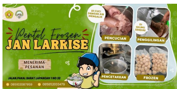
Gambar 5. Banner UMKM Pentol Jan Larrise