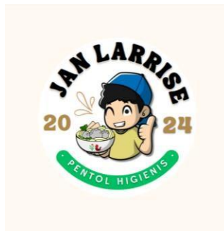
Gambar 4. Logo UMKM Pentol Jan Larrise

Design banner dan logo ini dibuat sesuai dengan keinginan pemilik UMKM mulai dari warna, bentuk, dan elemen lainnya yang ingin dicantumkan di banner. Dari keinginan pemilik UMKM tadi, banner dan logo ini kita edit se-bagus mungkin supaya bisa menarik perhatian pelanggan. Dalam design banner juga kita cantumkan informasi seperti alamat toko dan nomor telepon supaya pembeli bisa dengan mudah mendapatkan produk yang dijual.