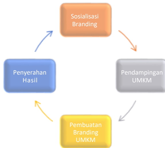
Gambar 1. Proses Kegiatan Pengabdian Masyarakat

Kegiatan yang dilakukan ini adalah menyerahkan hasil yang telah kita diskusikan bersama pemilik UMKM yaitu Bapak Slamet sesuai dengan design yang diinginkan. Hasil yang telah dibuat ini mencakup logo, banner dan pembuatan akun shopee pada UMKM pentol 'Jan Larrise'.