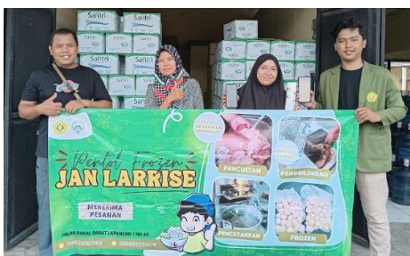
Gambar 7. Penyerahan Banner dan logo

Pada tahap terakhir ini kelompok Bina Desa UPN 'Veteran' Jawa Timur Kelurahan Pakal menyerahkan hasil yang sudah dibuat berupa banner, logo, dan akun Shopee. Dibuatkannya beberapa media tersebut dengan harapan bisa membuahkan hasil berupa kesuksesan pada UMKM Pentol Jan Larrise dalam jangka panjang. Kesuksesan pada UMKM bisa dibangun mulai dari media promosi yang menarik, membangun komunikasi yang baik dengan pelanggan, serta membuat kemasan produk yang menarik perhatian pembeli.