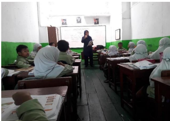
Gambar 1. Pelaksanaan Siklus I

Pelaksanaan tindakan penelitian dilakukan sesuai dengan rencana pembelajaran yang telah disusun. Kegiatan dimulai dengan orientasi masalah kepada siswa, diikuti dengan doa bersama yang dipimpin oleh ketua kelas, serta absen kehadiran siswa. Setelah itu, guru memastikan kesiapan siswa sebelum memulai pelajaran dan menjelaskan materi pembelajaran Bahasa Indonesia. Guru kemudian membagi siswa ke dalam 5 kelompok, masing-masing terdiri dari 5 orang, dengan anggota kelompok yang ditentukan secara acak agar situasi kelas lebih kondusif. Meskipun demikian, beberapa siswa awalnya enggan bergabung dengan kelompok tertentu, namun guru berhasil membujuk mereka untuk bekerja sama dengan teman sekelompok.