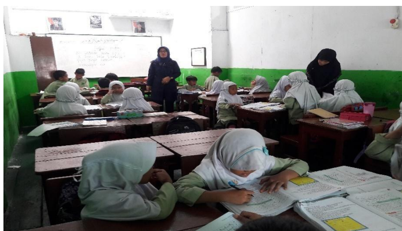
Gambar 3. Pelaksanaan Siklus II

Pelaksanaan penelitian pada siklus II dilakukan melalui empat tahapan, yaitu perencanaan, pelaksanaan tindakan, pengamatan, dan refleksi, yang serupa dengan siklus I. Kegiatan ini dilaksanakan pada hari Selasa, 06 November untuk pertemuan pertama, dan tes akhir pada siklus II dilaksanakan pada hari Kamis, 07 November 2018. Pada tahap ini, perhatian utama guru adalah memastikan bahwa setiap langkah dalam rencana pelaksanaan pembelajaran (RPP) diikuti dengan tepat. Guru diharapkan mengikuti langkah-langkah yang telah direncanakan dalam RPP agar tidak menyimpang dari rencana awal. Guru membuka pelajaran dengan memberi salam dan meminta ketua kelas untuk memimpin doa. Setelah doa, guru mengecek kehadiran siswa dan kemudian menjelaskan materi yang akan diajarkan pada hari itu, yaitu mengenai perhitungan debit dan kegunaannya dalam kehidupan sehari-hari. Setelah menjelaskan tujuan pembelajaran, guru memastikan semua siswa siap mengikuti pembelajaran. Guru lalu mengatur siswa untuk membentuk kelompok, masing-masing terdiri dari lima orang, sehingga terbentuk delapan kelompok. Kelompok-kelompok ini tidak diubah dari kelompok sebelumnya, dan terlihat bahwa siswa mulai menikmati model pembelajaran yang diterapkan.