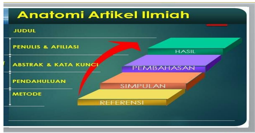
Gambar 1.2 Materi Anatomi Artikel Ilmiah