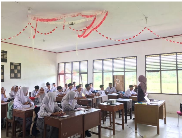
Gambar 2. Sesi diskusi dan tanya jawab

Anak yang mengalami kekerasan seksual akan mempengaruhi keadaan psikologis. Menurut Finkelhor (1984), dampak utama yang dialami oleh korban kekerasan seksual yaitu traumatisasi seksual atau korban mengembangkan pandangan yang menyimpang atau negatif tentang seksualitas akibat pengalaman seksual yang tidak sesuai usia dan dipaksakan, rasa tidak berdaya atau korban merasa kehilangan kendali atas tubuh dan situasi mereka, yang dapat menyebabkan perasaan takut dan cemas berkepanjangan, stigmatisasi atau korban merasa malu, bersalah, dan dicap negatif oleh masyarakat, yang dapat mengakibatkan isolasi sosial dan rendahnya harga diri, pengkhianatan atau korban merasa dikhianati, terutama jika pelaku adalah orang yang dikenal atau dipercaya, yang dapat merusak kemampuan mereka untuk mempercayai orang lain di masa depan. Hal yang harus dilakukan ketika menjadi sasaran target atau korban pelecehan seksual adalah segera minta pertolongan, simpan bukti pelecehan, pastikan berada dalam keadaan yang aman, ceritakan apa yang dialami, dan segera lakukan pemeriksaan kesehatan.