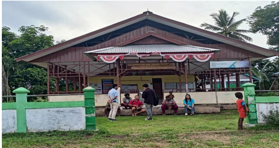
Gambar 1. Lokasi Kegiatan Pengabdian

Tahapan awal yang dilakukan oleh Tim Pengabdian adalah komunikasi dengan aparat kampung, guna menyiapkan waktu dan seluruh fasilitas kegiatan seperti penyiapan tempat dan undangan kegiatan. Kemudian setelah itu tim membentuk dan membagi tim kerja dalam pelaksanaan pengabdian nantinya.