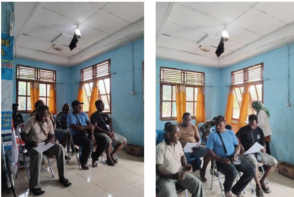
Gambar 3. Kegiatan Sosialisasi dan Pelatihan Pengelolaan Arsip Digital

Kegiatan pelatihan pengelolaan arsip digital dilaksanakan selama satu hari penuh dan diikuti oleh seluruh aparatur yang ada di Kampung Kweel, mulai dari sekretaris kampung, para kasie (seksi pemerintahan, seksi kesejahteraan, seksi pelayanan), para kepala urusan (kaur tata usaha dan umum, kaur keuangan, kaur perencanaan) sampai dengan bamuskam. Kegiatan pelatihan diawali dengan sambutan dari Sekretaris Kampung sekaligus membuka secara resmi kegiatan sosialisasi dan pelatihan.