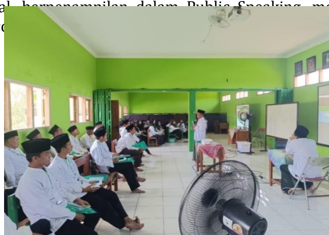
Gambar 1. Sesi pemberian materi oleh petugas pemateri

Metode ini memadukan teknik ceramah (pemberian materi) dan juga praktek secara langsung. Selama 50 menit para santri dibekali tentang bagaimana cara berdiri, menggunakan gesture, kontrol vokal, menghormat dalam Public Speaking menarik perhatian Public serta diperlihatkan contoh video atau presetasi proyektor.