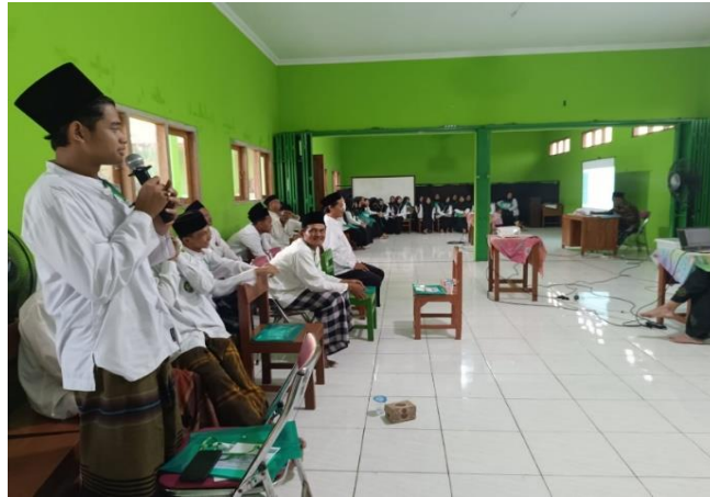
Gambar 2. Sesi praktik sekaligus penerapan dasar-dasar public speaking yang di pandu oleh pemateri

Selanjutnya, peserta atau santri diberikan waktu untuk praktik secara individual dengan cara memperkenalkan diri dengan menggunakan teknik yang telah dijelaskan oleh pemateri sebelumnya. Beberapa peserta atau santri diminta untuk mengikuti instruksi pemateri dan setelahnya menunjuk temannya untuk melanjutkan apa yang diinstruksikan pemateri.