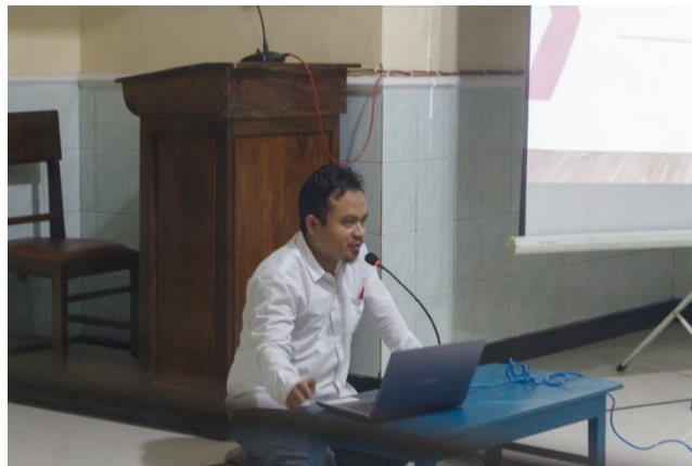
Gambar 4. Penyuluhan materi manajemen pengelolaan masjid di era modern