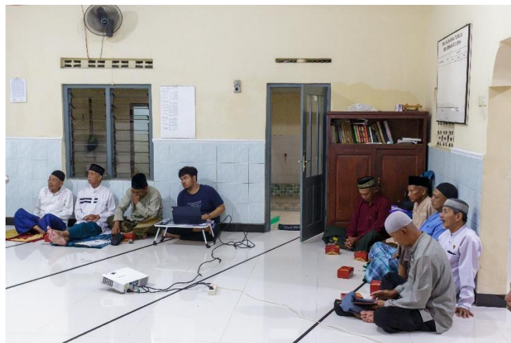
Gambar 5. Pelaksanaan Penyuluhan