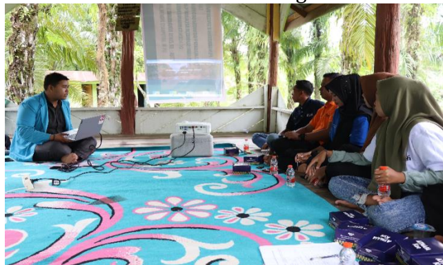
Gambar 6 Bimtek pelatihan pembuatan konten digital yang terdiri dari konten audio, visual serta audiovisual yang menggunakan teknologi informasi.

Bimtek dilakukan agar pengetahuan dan keterampilan pokdarwis benar0benar maksimal, bimtek ini dilakukan digunung pandan, peserta kegiatan didampingi oleh mahasiswa. Adapun keterampilan yang diajarkan adalah bagaimana merancang website, memasukan irformasi serta mendesain web tersebut agar menarik.