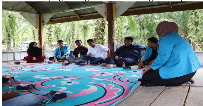
Gambar 8 Pendampingan Networking dan collaborating secara digital