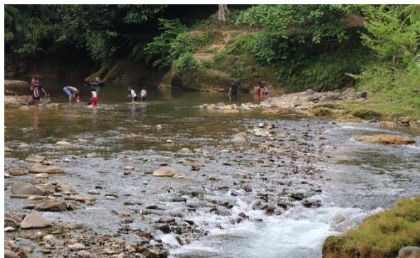
Gambar 4. Area pemandian Ekowisata Sungai Gunung Pandan

Peningkatan pengetahuan dan pemahaman dilakukan tim pengabdian kepada masyarakat melalui sosialisasi. Sosialisasi dilakukan sebanyak 2 kali dengan narasumber saat sosialisasi adalah ibu Dr. Zukya Rona Islami, sebagai pengampu mata kuliah ekowisata. Kegiatan sosialisasi juga dihadiri oleh anggota dinas pariwisata Aceh Tamiang. Saat sosialisasi, narasumber menyampaikan beberapa hal terkait pengelolaan ekowisata, bagaimana aktivitas wisata, bagaimana peran masyarakat sekitar termasuk UMKM dalam pembangunan ekowisata.