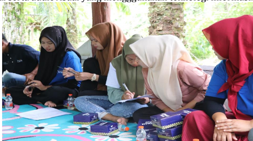
Gambar 7 Pendampingan Pengelolaan Platfom Digital berupa WEB GIS