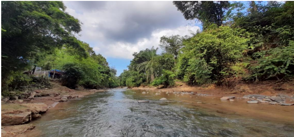
Gambar 1. Panorama Ekowisata Sungai Gunung Pandan

Potensi ekowisata unsur eksplorasi yang terdapat di wisata gunung pandan terdapat aliran sungai dan hamparan bebatuan mulai dai yang kecil hingga bebatuan yang besar. pada unsur segmentasi wisata pembagian blok pada tujuan wisata gunung pandan bisa dijadikan sebagai wisata keluarga dengan penyediaan fasilitas yang hampir memadai kemudian bisa dijadikan sebagai wisata minat khusus untuk memberikan pengalaman wisatawan dalam mengarungi sungai (rafting), kemudian bisa dijadikan wisata petualang, wisata banyak minat maupun wisata backpacker yang melakukan kegiatan camping disekitar area wisata.