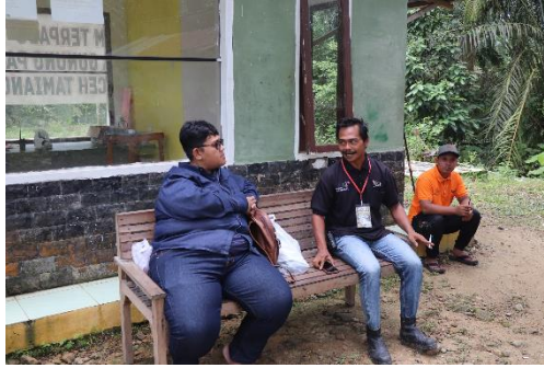
Gambar 2. Wawancara dengan Ketua POKDARWIS Sungai Gunung Pandan

permasalahan mana yang harus dibenahi terlebih dahulu. Setelah mengetahui potensi dan permasalahan yang ada maka diputuskan prioritas masalah utama yang harus dibenahi adalah Pokdarwis, melalui optimalisasi peran pokdarwis sebagai penggerak pariwisata maka memberikan pemahaman dan keterampilan kepada anggota pokdarwis sama halnya dengan upaya memajukan pariwisata itu sendiri. Beberapa fasilitas seperti tempat pemandian, struktur geologi dan geomorfologi di wisata Sungai Gunung Pandan dapat menjadi sumber belajar yang menarik untuk pembelajaran geografi