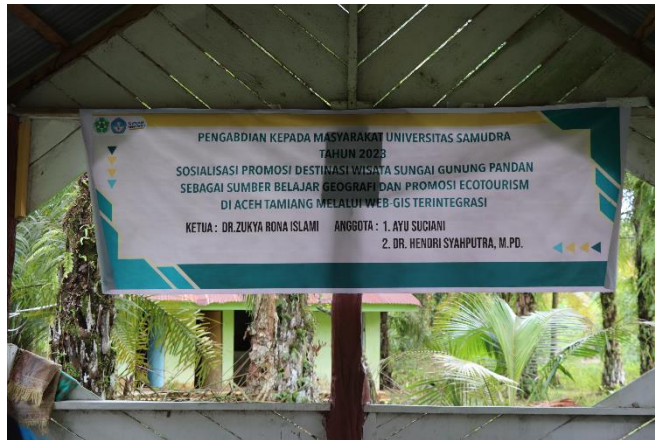
Gambar 5 Spanduk Sosialisasi kegiatan PKM

Bimtek dilakukan agar pengetahuan dan keterampilan pokdarwis benar0benar maksimal, bimtek ini dilakukan digunung pandan, peserta kegiatan didampingi oleh mahasiswa. Adapun keterampilan yang diajarkan adalah bagaimana merancang website, memasukan irformasi serta mendesain web tersebut agar menarik.