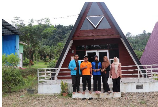
Gambar 3. Penginapan di Ekowisata Sungai Gunung Pandan