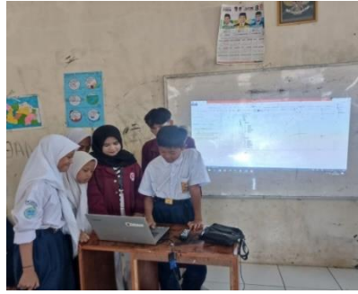
Gambar 1. Pelatihan Penulisan Word

Dalam praktek pembuatan penulisan word kami selaku kelompok kuliah kerja lapangan (KKN) memberikan tata cara penulisan dengan langsung dalam secara bertahap. Dengan memberikan naskah untuk di ketik ulang oleh para siswa/siswi SMP IT Bina Insani dan dilakukann secara bergantian sehingga dapat di pahami oleh keseluruhan.