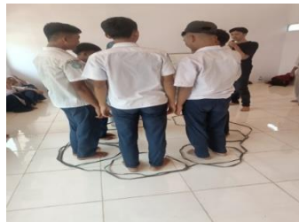
Gambar 2 Game Lompat Tali

Dalam metode pembelajaran penulisan di word kami sering melakukan kegiatan game di tengah pembelajaran sehingga siswa/siswi tidak bosan dan dapat menikmati kegiatan tersebut