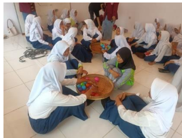
Gambar 3 Lomba Bola Dalam Nampan

Setelah melakukan kegiatan pelatihan penulisan di word kami sering melakukan senam pada hari minggu pagi bersama warga setempat pada pukul 07:00 – selesai. Setelah itu kami melakukan kegiatan pelatihan sekaligus praktek UMKM pada pukul 16:00 – selesai setiap hari minggu. Kegiatan ini kami berfokus pada pelaku UMKM, yang dilakukan secara bertahap. Sehingga kegiatan bisa berjalan secara efektif, Dan kegiatan tersebut kami lakukan sebanyak empat kali dalam sebulannya.