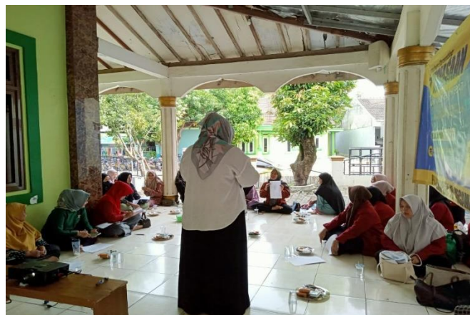
Gambar 3. Pemaparan Strategi peserta dalam mengupayakan 7 Kebiasaan Anak Indonesia Hebat

Materi ini bertujuan tidak hanya memberikan pengetahuan tentang 7 kebiasaan indoneisa hebat tetapi mengajak kembali para guru mengenali anak, mulai dari siapa anak ?, apa saja hak anak ? dan mengenali diri (orang tua), lalu Menyusun pohon harapan, yang di dalam pohon harapan tersebut, berisi harapan setiap ibu terhadap anak-anaknya, akar pohon diibaratkan sebuah harapan, dan batang pohohon di ibaratkan do'a dan usaha di ibaratkan sebuah daun/tangkai, dan buah mengibaratkan sebuah hasil. Hasil dari buah pasti tidak selalu semuanya baik akan tetapi jika tidak ada proses, tidak ada harapan dan tidak doa usaha maka tidak akan menghasilkan buah apapun. Usaha yang bisa dilakukan yaitu melalui kebiasaan yang baik, dan semua peserta menyepakati. Selanjutnya, materi dilanjutkan dengan pembahasan inti mengenai 7 Kebiasaan Anak Indonesia Hebat, yang diawali dengan penjelasan teori dari beberapa ahli, seperti definisi, tujuan dan manfaat. Setelah itu, dilanjutkan dengan sesi pembuatan rencana untuk mewujudkan 7 Kebiasaan Anak Indonesia Hebat, yang mencakup identifikasi kendala dan upaya penyelesaiannya melalui refleksi diri.