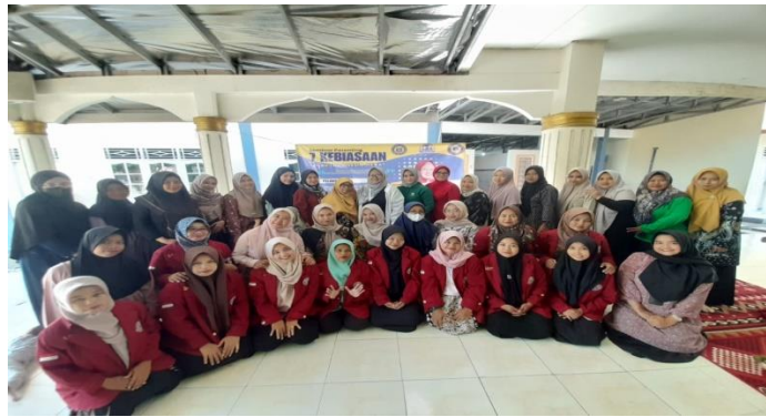
Gambar 4. Foto Bersama dengan peserta

pelaksanaan rencana dan strategi yang dibuat selama Pelaksanaan PPL berlangsung. Dengan membuat daftar ceklis dari rencana yang telah orang tua buat. Pendekatan yang berkesinambungan antara sekolah dan keluarga akan memberikan dampak yang lebih besar dalam membentuk karakter anak. Diharapkan, dengan adanya sinergi antara guru dan orang tua, anak-anak dapat menginternalisasi nilai-nilai dari 7 Kebiasaan Anak Indonesia Hebat, yang tidak hanya berfokus pada aspek akademis, tetapi juga pada perkembangan moral, sosial, dan emosional mereka. Dengan demikian, pembentukan kebiasaan yang baik akan menjadi fondasi yang kokoh bagi masa depan mereka sebagai individu yang memiliki integritas, kedisiplinan, dan rasa tanggung jawab yang tinggi