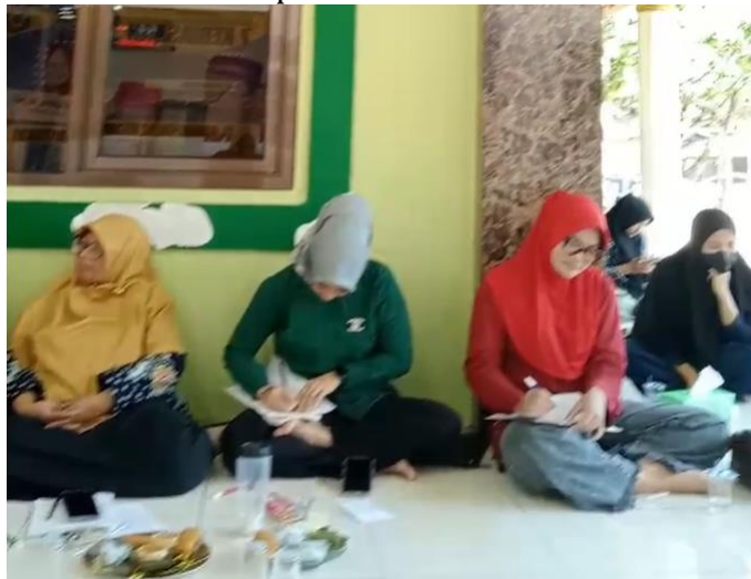
Gambar 3. Peserta sedang melakukan post test

Selain itu , orang tua mengoptimalkan waktu bersama pada malam hari karena waktu siang hari mereka harus pergi bekerja, misalnya menetapkan waktu tidur yang konsisten dan memastikan anak mendapatkan cukup tidur di malam hari. Mengatur rutinitas tidur yang menenangkan, seperti membaca cerita atau mendengarkan musik lembut sebelum tidur, akan membantu anak tidur lebih cepat dan berkualitas.