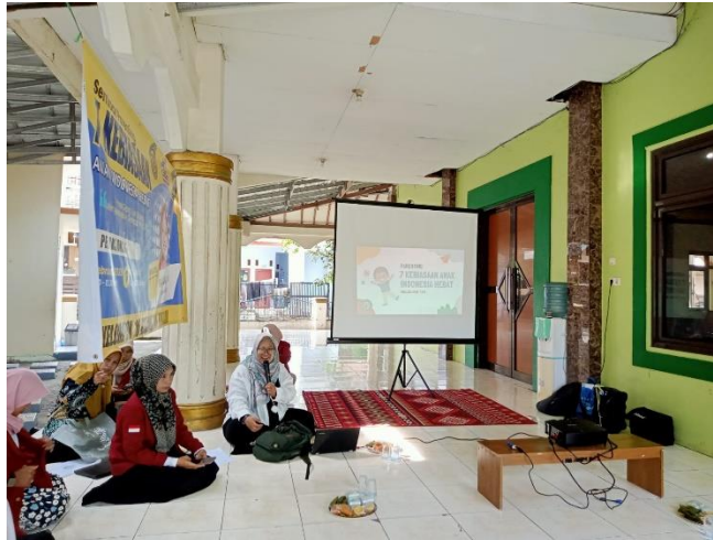
Gambar 1 . Pelaksanaan Kegiatan Sosialisasi

Materi ini bertujuan tidak hanya memberikan pengetahuan tentang 7 kebiasaan indoneisa hebat tetapi mengajak kembali para guru mengenali anak, mulai dari siapa anak ?, apa saja hak anak ? dan mengenali diri (orang tua), lalu Menyusun pohon harapan, yang di dalam pohon harapan tersebut, berisi harapan setiap ibu terhadap anak-anaknya, akar pohon diibaratkan sebuah harapan, dan batang pohohon di ibaratkan do'a dan usaha di ibaratkan sebuah daun/tangkai, dan buah mengibaratkan sebuah hasil. Hasil dari buah pasti tidak selalu semuanya baik akan tetapi jika tidak ada proses, tidak ada harapan dan tidak doa usaha maka tidak akan menghasilkan buah apapun. Usaha yang bisa dilakukan yaitu melalui kebiasaan yang baik, dan semua peserta menyepakati. Selanjutnya, materi dilanjutkan dengan pembahasan inti mengenai 7 Kebiasaan Anak Indonesia Hebat, yang diawali dengan penjelasan teori dari beberapa ahli, seperti definisi, tujuan dan manfaat. Setelah itu, dilanjutkan dengan sesi pembuatan rencana untuk mewujudkan 7 Kebiasaan Anak Indonesia Hebat, yang mencakup identifikasi kendala dan upaya penyelesaiannya melalui refleksi diri.