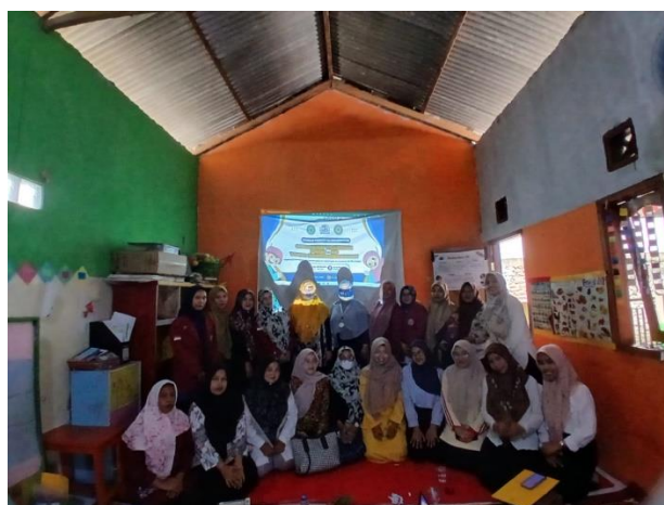
Gambar 1.2 Foto Bersama Peserta Sosialisasi