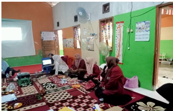
Gambar 1.3 Sesi Tanya jawab

lain: Kecemasan anak menghadapi lingkungan baru, Tuntutan akademik yang lebih tinggi di SD, Perubahan pola interaksi sosial, Kemampuan anak dalam mengikuti instruksi dan aturan yang lebih kompleks, Kemandirian anak dalam mengelola waktu dan tugas. Identifikasi ini membantu pihak PAUD Nurul Islah dalam merancang program pendampingan yang lebih terarah untuk membantu anak-anak dan orang tua menghadapi tantangan tersebut.