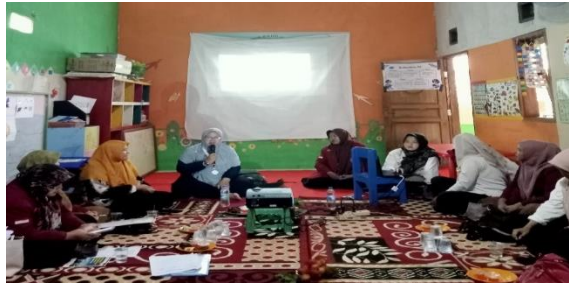
Gambar 1.1 Penyampaian Materi dari Narasumber

Berdasarkan hasil evaluasi, diperoleh beberapa temuan penting: