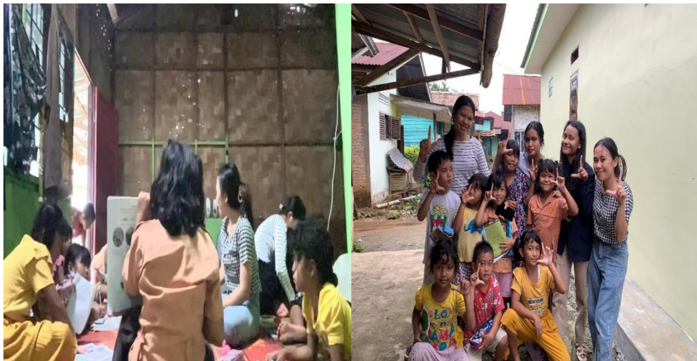
Gambar 3 Kegiatan Literasi dan Numerasi