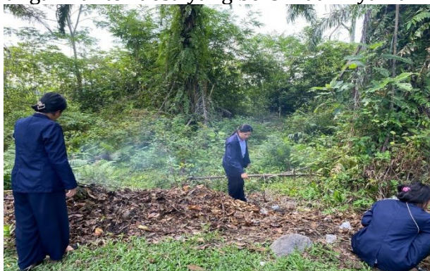
Gambar 1 Membantu Kegiatan Kebersihan

Kegiatan awal mulai tanggal 10-11 Februari 2025 pukul 08.00 – 13.00 Wib. Adapun kegiatannya yaitu membantu membersihkan kantor kepala desa, seperti membersihkan meja, menyapu lantai, dan membersihkan aula/jambur. Tujuan dari kegiatan awal ini adalah agar terciptanya ruangan kantor desa yang bersih dan nyaman.