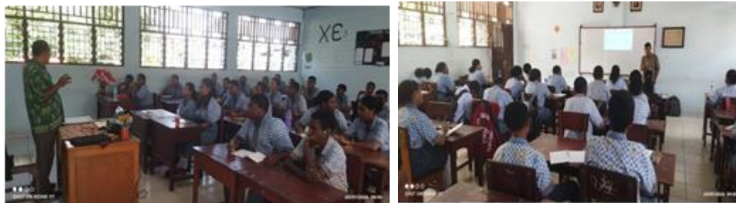
Sesi diskusi dan tanya jawab

Satu sisi, sejumlah pertanyaan ini menunjukkan ketertarikan siswa untuk mengetahui tindakan kekerasan dalam bentuk bullying. Disisi lain, pertanyaan-pertanyaan ini memberikan indikasi bahwa masih lemahnya pemahaman siswa terkait dimensi bullying, mekanisme pencegahan dan pelaporan serta konteks bullying secara global.