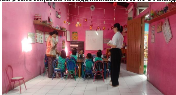
Gambar 1. Pembelajaran menggunakan metode Drilling

Metode drill dengan berbantuan media sosial Youtube mampu memberkan gambaran, mengarahkan lewat tutorial yang diberikan oleh Youtube tersebut. Dalam