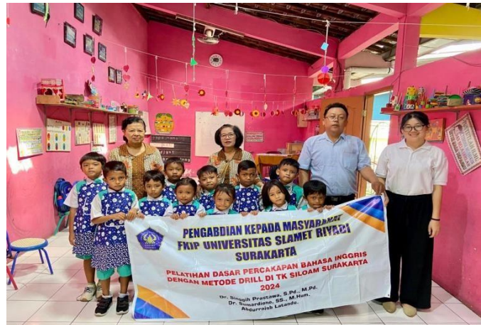
Gambar 2. Peneliti, guru guru dan anak anak Kelas A TK Siloam Surakarta

belajar. Kompetensi guru yang ditopang dengan media sosial yang dijadikan metode ajar Youtube mampu mengubah mindset pengajar untuk memberi celah dan mendapatkan jalan terbaik guna mencapai tujuan belajar (Risqa Ulandari dkk, 2021). Menggunakan tutorialnya Youtube, memberi kemudahan dengan pola lengkapnya guna menggiring pembelajar sebagai pengajar di TK tersebut. Berdasarkan penggunaan media YouTube untuk mengajar guru bagi anak TK akan menghindari misuse /salah penggunaan bagi peserta didik, karena peserta didik tidak langsung belajar lewat Media YouTube namun guru dan pengajar yang melakukannya. Proses pembelajaran dengan metode Drilling pada mata Pelajaran Bahasa Inggris keterampilan berbicara tertopang dengan bantuan media belajar YouTube yang sudah dipelajari sebelumnya dengan bimbingan teknis peneliti. Kemandirian guru dalam proses perolehan pengetahuan dalam mengajar sesuai dengan kondisi masyarakat belajar sekarang yang harus literal dalam menggunakan teknologi.