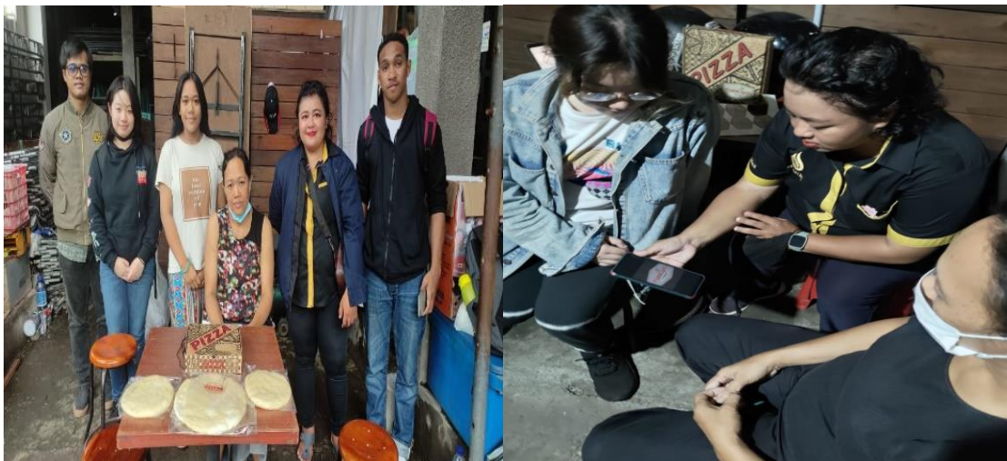
Gambar 2. Kegiatan pelatihan pembuatan label kemasan

Pada tahap pelaksanaan kegiatan, untuk mengatasi permasalahan mitra terlebih dahulu diberikan pelatihan desain kemasan. Pelatihan desain kemasan ini dilakukan secara offline, dan seluruh tim pelaksana pengabdian masyarakat mengikuti pelatihan tersebut. Tahapan ini diawali dengan pengenalan oleh ketua pelaksana tentang pentingnya desain kemasan. Dalam kegiatan ini mitra dapat memahami bahwa label kemasan sangat penting karena dengan memiliki kemasan yang unik dapat membuat pelanggan menjadi lebih tertarik dan mempermudah pelanggan saat melakukan pemesanan pizza. Beranjak dari kesempatan ini, mitra juga ditunjukkan beberapa desain kemasan lain yang dapat digunakan mitra sehingga mitra memiliki berbagai variasi yang nantinya dapat digunakan sebagai identitas bisnis mitra pada kemasan. Setelah materi disampaikan, para mitra sangat antusias untuk memindahkan bisnisnya secara online dan yakin bahwa bisnisnya akan lebih diminati konsumen.