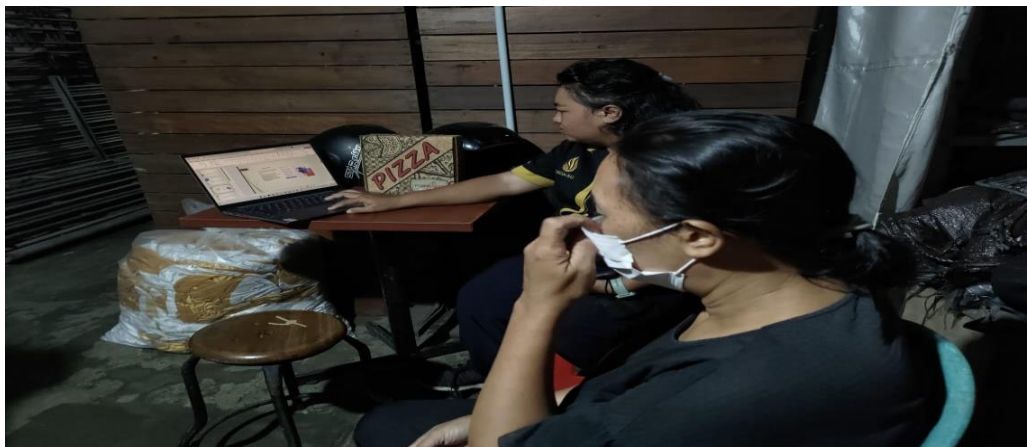
Gambar 3. Pelatihan Strategi Bisnis di Era Digital