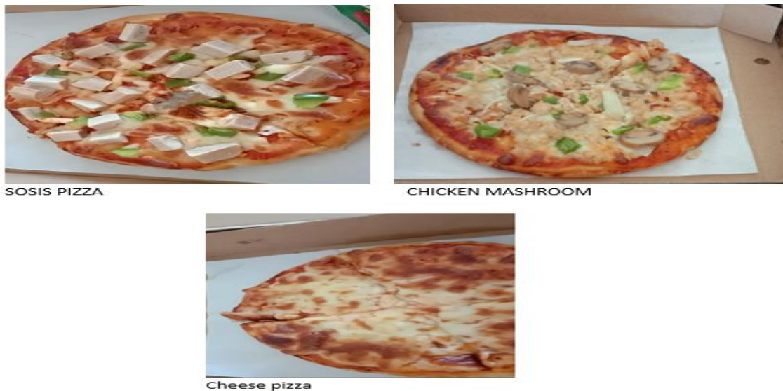
Gambar 1 varian pizza yang paling diminati konsumen.

Mitra pengabdian masyarakat saat ini adalah UKM Pizza Omi. UKM Pizza Omi merupakan UKM yang bergerak dalam bidang kuliner rumahan. UKM ini sanggup membuat dan mengemas pizza sesuai dengan permintaan konsumen yang dilakukan 2 - 5 hari sebelum pizza dikonsumsi. Berdasarkan hasil wawancara tim pengabdian masyarakat ITB STIKOM Bali terhadap pemilik UKM yakni ibu Lina Heryati, mengatakan bahwa Pizza Omi berdiri sejak pertengahan 2020, di mana dalam hal ini UKM dapat menyediakan Pizza dengan ukuran small dan medium serta memiliki 6 varian rasa (topping) antara lain Chicken, Cheers Mushroom, Meat Lover, Chicken Mushroom, Sosis Pizza dan Cheese, namun yang paling diminati konsumen adalah Chicken Mushroom, Sosis dan Cheese Pizza. Gambar 1 adalah tiga jenis pizza yang paling diminati konsumen Pizza Omi.