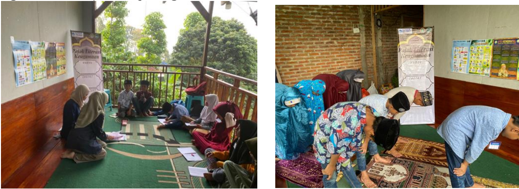
Gambar 1. Proses Pengayaan Literasi dan Praktik Sholat Jamaah

Setelah diberikan penjelasan, Anak-anak menunjukkan keantusiasannya dan dapat mengulang isi materi dengan jelas setelah diberikan beberapa pertanyaan dan praktik . Kegiatan transfer ilmu terkait keagamaan ditunjukkan pada gambar 1 berikut.