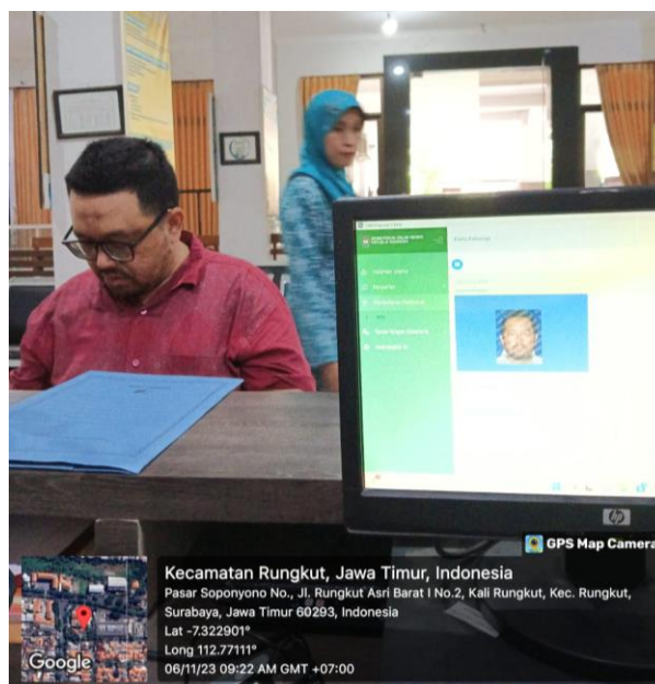
Gambar 5. Pengaktifan Aplikasi IKD di Kecamatan Rungkut

Langkah awal ini dimulai dengan melakukan koordinasi langsung dengan Bapak Rukun Warga (RW) yang bertugas menyampaikan informasi kepada Bapak Rukun Tetangga (RT). Koordinasi ini menjadi titik awal untuk menjalankan program pendampingan layanan administrasi kependudukan dan juga sosialisasi mengenai pengaktifan Identitas Kependudukan Digital (IKD). Setelah koordinasi selesai, langkah selanjutnya melibatkan penerapan program yang turun langsung ke rumah masyarakat. Penulis melaksanakan program pendampingan dengan mengunjungi rumah masyarakat untuk memberikan informasi terkait kekurangan data dan juga pembaharuan data yang belum dilakukan oleh masyarakat juga sosialisasi mengenai pengaktifan IKD. Kegiatan ini bertujuan untuk memberikan pemahaman yang lebih mendalam kepada masyarakat tentang pentingnya memiliki dokumen yang lengkap dan juga terbaru serta penggunaan Identitas Kependudukan Digital. Setelah survey dilakukan langsung di rumah masyarakat, program selanjutnya akan diimplementasikan di Kantor Kelurahan atau Kecamatan. Masyarakat yang sudah mendapatkan sosialisasi mengenai pentingnya Identitas Kependudukan Digital dapat menguruskan IKD tersebut di Kelurahan Kalirungkut ataupun di Kecamatan Rungkut.