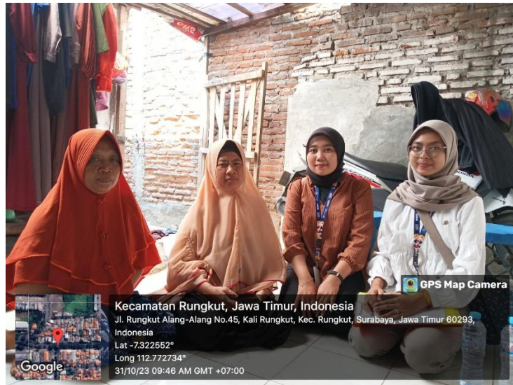
Gambar 4. Koordinasi dengan Ketua RT

Langkah awal ini dimulai dengan melakukan koordinasi langsung dengan Bapak Rukun Warga (RW) yang bertugas menyampaikan informasi kepada Bapak Rukun Tetangga (RT). Koordinasi ini menjadi titik awal untuk menjalankan program pendampingan layanan administrasi kependudukan dan juga sosialisasi mengenai pengaktifan Identitas Kependudukan Digital (IKD). Setelah koordinasi selesai, langkah selanjutnya melibatkan penerapan program yang turun langsung ke rumah masyarakat. Penulis melaksanakan program pendampingan dengan mengunjungi rumah masyarakat untuk memberikan informasi terkait kekurangan data dan juga pembaharuan data yang belum dilakukan oleh masyarakat juga sosialisasi mengenai pengaktifan IKD. Kegiatan ini bertujuan untuk memberikan pemahaman yang lebih mendalam kepada masyarakat tentang pentingnya memiliki dokumen yang lengkap dan juga terbaru serta penggunaan Identitas Kependudukan Digital. Setelah survey dilakukan langsung di rumah masyarakat, program selanjutnya akan diimplementasikan di Kantor Kelurahan atau Kecamatan. Masyarakat yang sudah mendapatkan sosialisasi mengenai pentingnya Identitas Kependudukan Digital dapat menguruskan IKD tersebut di Kelurahan Kalirungkut ataupun di Kecamatan Rungkut.