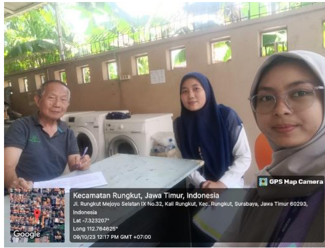
Gambar 2. Koordinasi dengan ketua RT