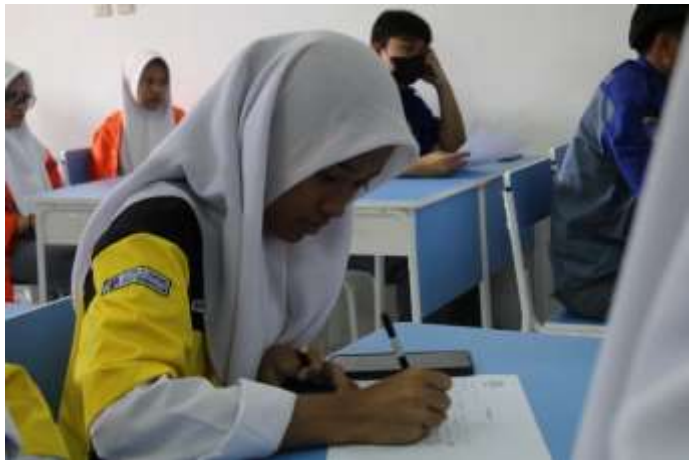
Gambar 2. Pretest pengetahuan asertif komunikasi Siswa – Siswi SMKS 11 PGRI Serpong

Aktifitas yang dilakukan pertama kali adalah melakukan pretest untuk mengetahui sejauh mana para siswa mengetahui mengenai digital marketing.