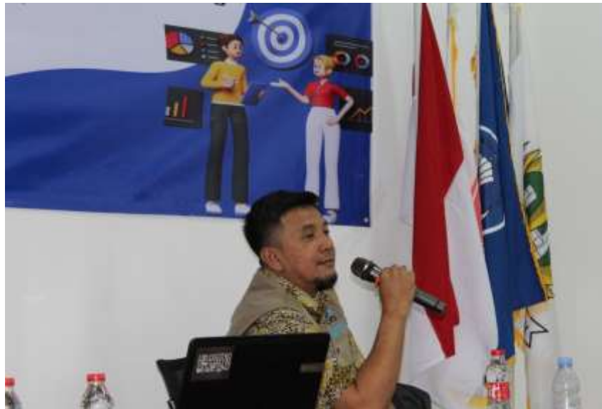
Gambar 4. Pemaparan Komunikasi Asertif oleh pemateri.

Selesai materi dipaparkan oleh pemateri, kemudian dilakukan sesi bermain peran dan diskusi dengan para siswa yang dipandu oleh moderator. Bermain peran dan diskusi berjalan dengan baik, seru dan penuh antusias dan rasa ingin tahu yang tinggi dari para siswa. Banyak pertanyaan dan tanggapan serta keluhan dari para siswa sebagai indikasi adanya respon yang baik antara pemberi materi dengan para siswa peserta.