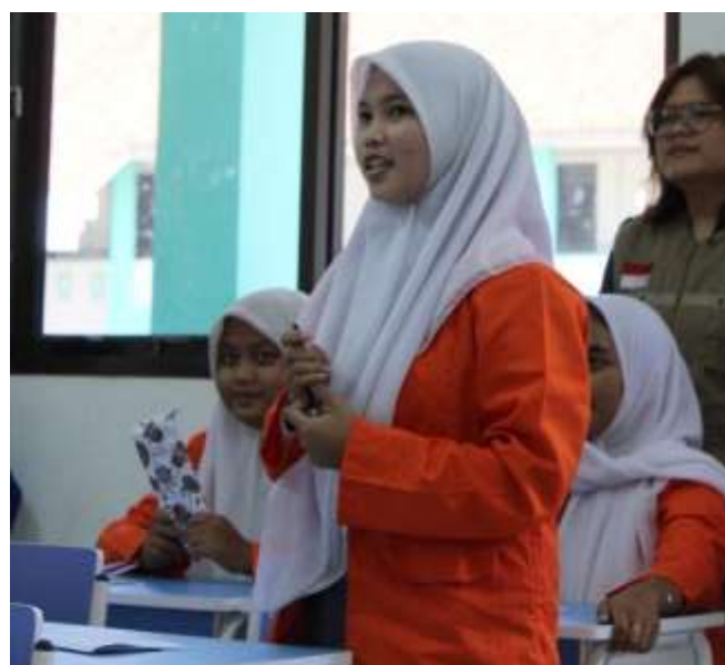
Gambar 5. Sesi bermain peran dan diskusi tentang komunikasi asertif.