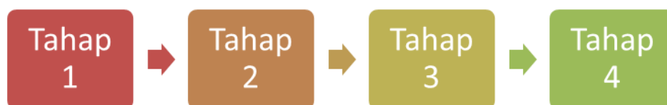
Gambar 1. Metode Pengabdian Masyarakat

Para peserta mengisi kuisioner singkat untuk mengukur tingkat asertif yang dimiliki oleh peserta saat itu. Selain itu, kuisioner juga diberikan untuk mengetahui sejauh mana peserta memahami tentang konsep komunikasi asertif dan bagaimana perilaku asertif dilakukan.