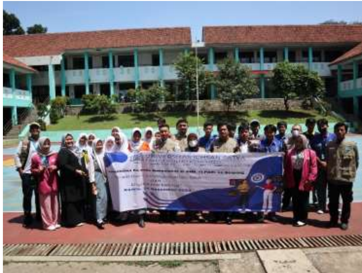
Gambar 6. Sesi foto Bersama Tim Pemateri Dosen Fak Ilmu Komputer Univ Ichsan Satya, Perwakilan Guru dan Siswa Peserta.

Sesi terakhir ditutup dengan post-test, lalu doa penutup dan foto bersama perwakilan guru SMKS 11 PGRI Serpong, peserta pelatihan dan Tim Dosen Fak Ilmu Komputer Universitas Ichsan Satya.