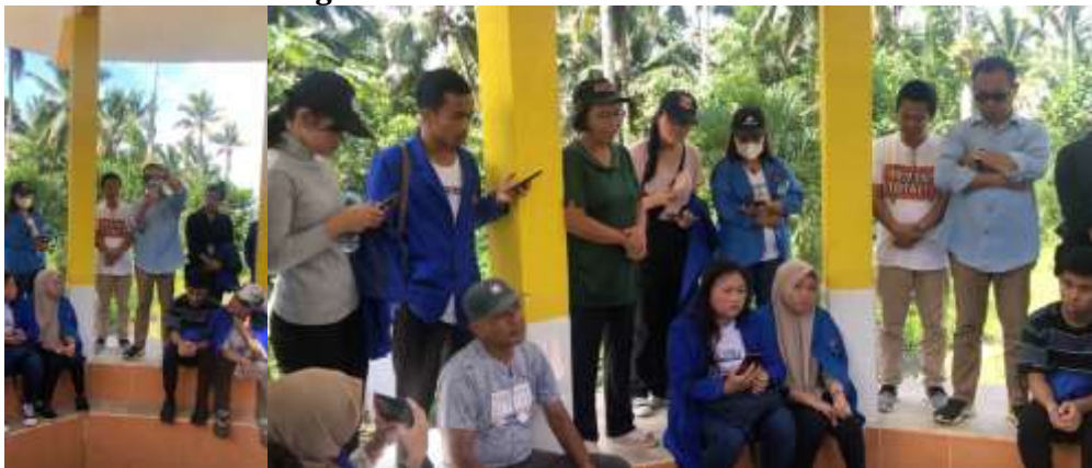
Gambar: Pemberian arahan, sejarah Lesung Batu

Sampai di lokasi, mahasiswa mendapat arahan tentang Lesung Batu yang ada di hadapan mereka. Arahan ini disampaikan langsung oleh dosen sejarah lokal dan pegawai desa yang mengetahui secara rinci sejarah tempat tersebut.