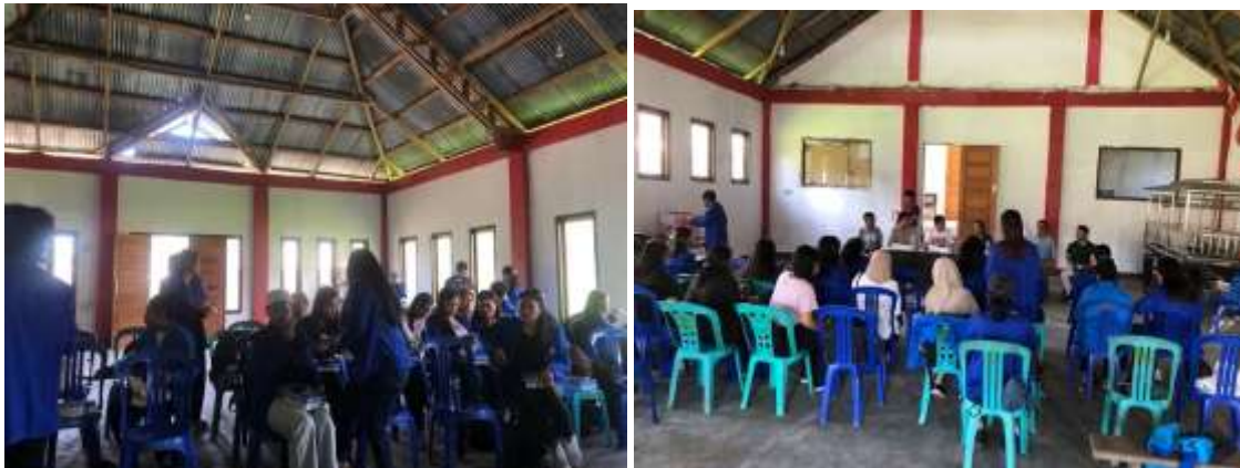
Gambar: Sosialisasi, koordinasi dan penerimaan mahasiswa dan dosen pendamping di kantor desa Kali Oki

Kegiatan diawali dengan berkumpul dalam sebuah aula di kantor kelurahan Desa Kali Oki, Minahasa Tenggara. Mahasiswa dan dosen pendamping diterima dengan terbuka oleh pihak perangkat desa. Pertemuan yang berlangsung selama kurang lebih 2 jam dirangkum dalam beberapa bagian. Bagian pertama, sambutan dari dosen pendamping dan pegawai desa, kemudian perkenalan singkat di mulai dari dosen pendamping dan mahasiswa sebagai tamu, serta dilanjutkan perangkat desa sebagai tuan rumah. Perkenalan ini dimaksudkan untuk lebih mempererat kolaborasi mahasiswa dan perangkat desa setempat. Bagian selanjutnya sebagai bagian inti yakni koordinasi. Kegiatan ini bermaksud dalam rangka koordinasi dan pengarahan dari dosen pendamping dan pihak kantor desa. Di dalam aula pada tanggal 27 Mei 2023 dibahas tentang sejarah singkat Kali Oki dan koordinasi sebelum ke lapangan.