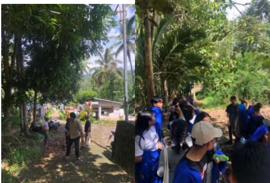
Gambar: Jalan menuju Lokasi