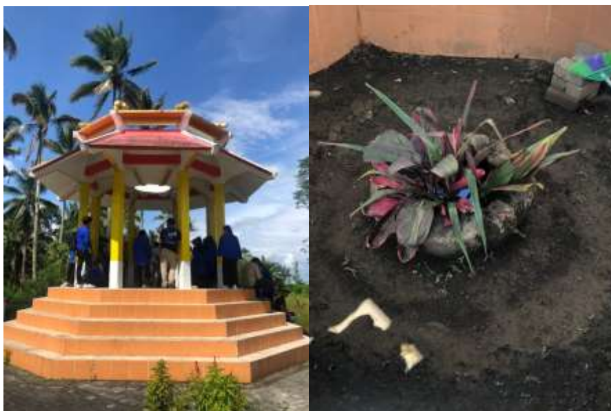
Gambar: Lokasi Lesung Batu, Kali Oki, Tombatu

Meskipun awalnya terdapat ketegangan antara Tonaas Wangko Ukung Oki dan Simon Cos, namun melalui dialog dan negosiasi, mereka berhasil mencapai kesepakatan yang saling menguntungkan. Di bawah kepemimpinan Simon Cos, VOC setuju untuk mengakui kekuasaan Tonaas Wangko Ukung Oki dan menghormati budaya lokal serta peran wanita. Keahlian dan kepemimpinan Tonaas Wangko Ukung Oki tidak hanya diakui dalam ranah politik tetapi juga dalam urusan dagang dengan VOC. Kepemimpinannya membawa kemakmuran bagi lima wilayah di bawahnya, dengan pembangunan sarana transportasi seperti jalan Tombatu-Tababo dan Belang yang menghubungkan wilayah tersebut.