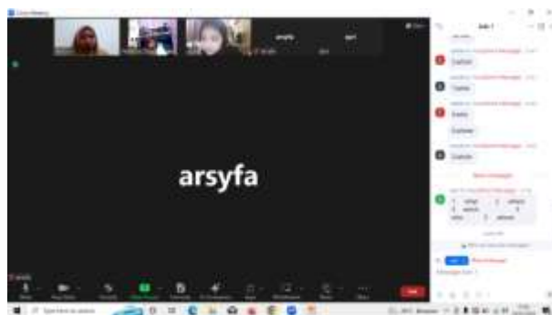
Gambar 3. Aktivitas di Ruang Zoom Melatih Kemampuan Writing

Gambar 3 adalah pemanfaatan kolom obrolan atau zoom chat untuk melatih kemampuan menulis pada peserta didik tingkat kids . Peserta didik akan berlatih menuliskan kosakata dalam Bahasa Inggris