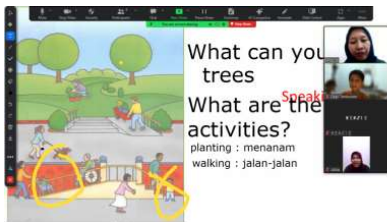
Gambar 6. Aktivitas Speaking di Ruang Zoom

Gambar 5 menunjukkan aktivitas yang dilaksanakan di ruang zoom kepada peserta didik pada level conversation . Peserta didik memperhatikan lebih jelas karena mereka langsung mendengarkan dari ruang zoom ke ruangan pribadi mereka tanpa adanya gangguan dari jumlah peserta didik yang terlalu banyak. Hal ini memungkinkan peserta didik dapat lebih mengembangkan kemampuan listening mereka dengan baik.