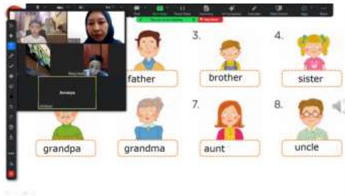
Gambar 1. Interaksi di Ruang Zoom Mengenalkan Kosakata Dasar

Pada gambar 1 peserta didik di tingkat preschool mendapatkan informasi tentang kosakata dasar yang meliputi listening , reading , dan speaking . Peserta didik akan mendengarkan bagaimana mengucapkan kosakata tersebut dengan benar, mempraktikkan pelafalannya, dan melihat bagaimana tulisannya untuk kemudian berlatih membaca kosakata sederhana tersebut.