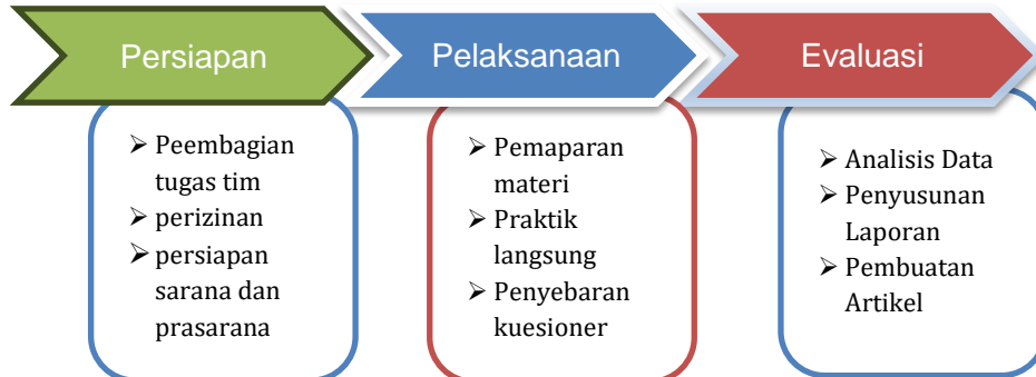
Gambar 2: Tahapan Kegiatan Pengabdian

Adapun tahapan-tahapan dalam pengabdian ini dapat dilihat pada gambar 1 di bawah ini