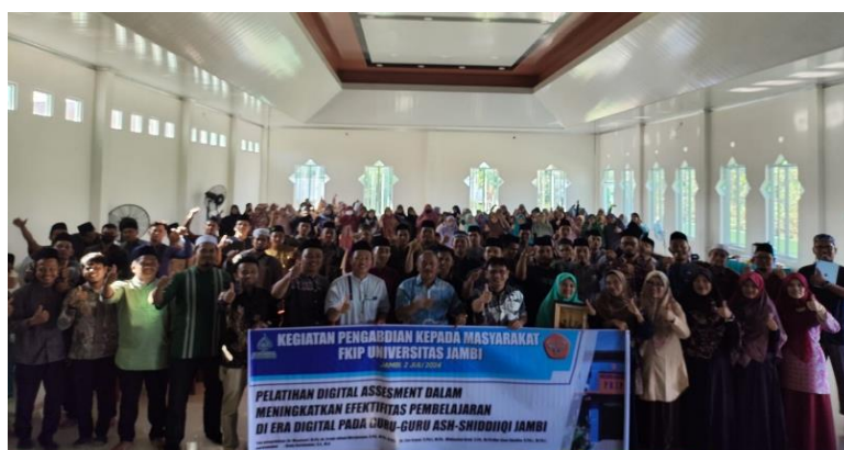
Gambar 5: Foto bersama

Setelah peserta memahami apa itu kahoot beserta fitur-fitur yang terdapat didalamnya, kegiatan pelatihan dilanjutkan dengan praktik merancang asesmen berbasis digital dengan menggunakan aplikasi kahoot. Dalam melakukan praktiknya guru langsung dibimbing oleh tim pengabdian mulai dari tahap pembuatan akun di aplikasi kahoot, dilanjutkan dengan perancangan butir-butir asesmen, proses uji coba asesmen, hingga melakukan evaluasi dari hasil asesmen. Diharapkan dari praktik langsung yang dilakukan para guru tidak menemui kendala yang berarti untuk melakukan asesmen dengan menggunakan aplikasi kahoot dalam mata pelajaran yang diampu oleh mereka masing-masing.