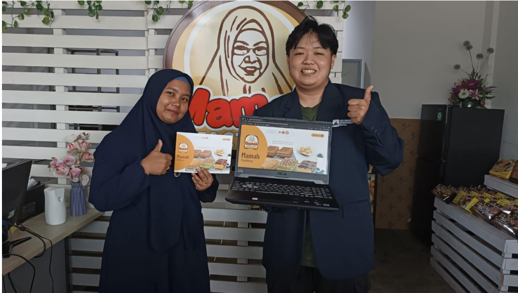
Gambar 2. Penyerahan Luaran KP kepada Mitra