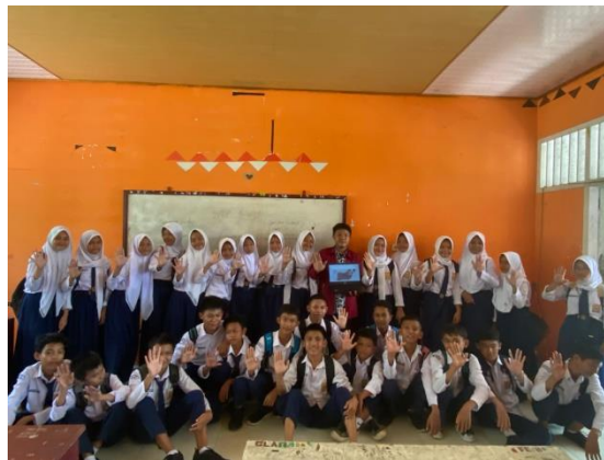
Gambar 2 : Foto bersama peserta sosialisasi.

Secara keseluruhan, dampak dari kegiatan sosialisasi terhadap iklim sekolah di SMP 14 Seluma menunjukkan bahwa pendekatan yang digunakan dalam sosialisasi tidak hanya efektif dalam meningkatkan kesadaran dan pemahaman tentang bullying, tetapi juga dalam menciptakan perubahan positif dalam budaya sekolah. Peningkatan interaksi sosial yang inklusif, penurunan tindakan perundungan, dan penguatan hubungan antar siswa mencerminkan keberhasilan kegiatan ini dalam membangun lingkungan sekolah yang lebih aman dan mendukung. Dengan demikian, kegiatan sosialisasi ini menjadi langkah penting dalam upaya menciptakan iklim sekolah yang kondusif bagi perkembangan dan kesejahteraan siswa.