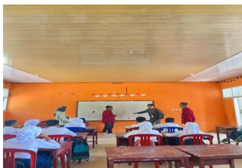
Gambar 1 : Menjelaskan materi bullying.