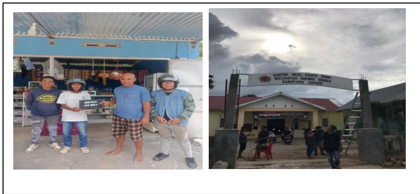
Gambar 3: Pembagian Papan Nama di RT/RT serta Dusun serta Perbaikan Gapura

Mahasiswa KKN FEB Unwira, program kerja ke-1 dari Prodi Ekonomi Pembangunan juga membuat papan nama bagi para Kepala Dusun, Ketua RT dan Ketua RW. Dari program pembuatan papan nama ini diharapkan dapat membuat masyarakat setempat tidak lagi merasa kesulitan dalam mencari alamat tempat tinggal Ketua RT/RW dan Kepala Dusun, ini sesuai dengan hasil pengabdian yang dilakukan oleh (Nurhadi dkk., 2020); (Florian G. A. Toni dkk., 2023). Mahasiswa KKN kemudian mendatangi satu per satu rumah Ketua RT/Ketua RW dan Kepala Dusun di Desa Penfui Timur. Papan yang dibuat berjumlah 26 buah dengan rincian 20 papan RT, 4 papan RW dan 2 papan untuk Kepala Dusun. Untuk program kerja ke-2 yang dilakukan yaitu pembuatan RT/RW serta Dusun dan perbaikan gapura kantor di Desa Penfui Timur dengan renovasi sehingga warga dapat mengetahui RT/RW Dusun yang ada di Desa Penfui Timur.