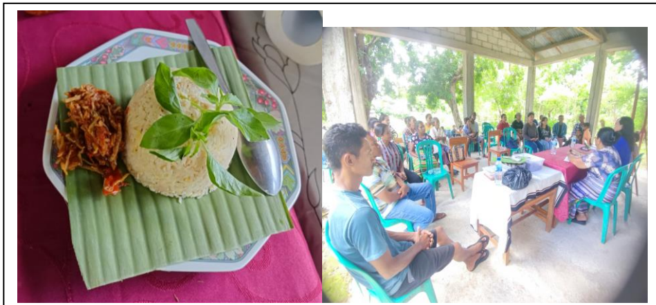
Gambar 4: Sosialisasi Pola Konsumsi Pangan Lokal dan Pembuatan Nasi Pisang Parut

Program pengabdian ke-3 dari Prodi Ekonomi Pembangunan yang dilaksanakan saat KKN di Desa Penfui Timur yaitu mengadakan pelatihan cipta menu pangan lokal dari buah pisang menjadi nasi pisang serut. Sehingga warga di Desa Penfui Timur diharapkan dapat berbagi ilmu tentang pengelolaan pisang menjadi cemilan pisang untuk alternative pengganti nasi (Dewi et al., 2021). Pada program pengabdian ke-3 ini tim pengabdian berkolaborasi dengan Dosen Pendamping Lapangan yaitu Ibu Emiliana Martuti lawalu, SE., ME dan Ibu Agnes Susanti Indrawati, SE., ME untuk memberikan sosialisasi,