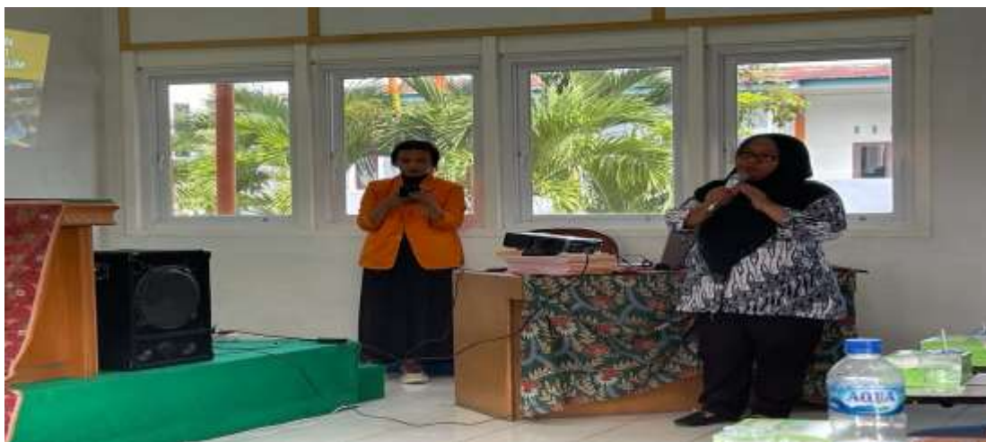
Gambar 3. Narasumber memberikan materi mengenai penggunaan Mendelay

Sangat mudah untuk menemukan dan memasukkan referensi dan otomatis membuat kutipan dalam beberapa detik dan menyusun daftar pustaka dengan cepat tanpa membutuhkan waktu berjam-jam untuk menulis atau copy paste (Hidayatullah et al., 2022). Karena peserta sangat antusias saat pelatihan berjalan, banyak orang yang berpartisipasi secara aktif mengajukan pertanyaan, karena fakta bahwa pengetahuan yang diberikan sangat menarik bagi mereka yang meningkatkan pemahaman peserta bagaimana mengatur referensi dan penyiapan menggunakan aplikasi mendeley setelah sebelumnya tidak memahami informasi. Mahasiswa harus diberi pelatihan penggunaan mendeley agar mereka dapat menghindari plagiasi saat menulis proposal dan skripsi ilmiah. Menurut hasil penelitian, Ketidaksengajaan menyebabkan plagiasi siswa., tidak hanya itu, karena kurangnya pengetahuan tentang prosedur pengutipan.