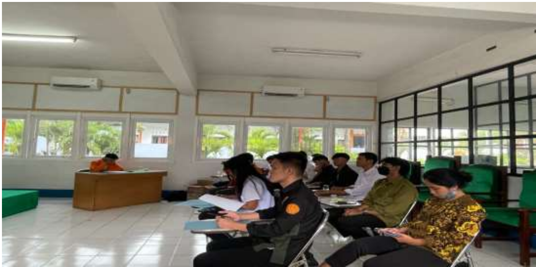
Gambar 2. Suasana Kegiatan Sosialisasi dan Pendampingan Penggunaan Aplikasi Mendeley

Sangat mudah untuk menemukan dan memasukkan referensi dan otomatis membuat kutipan dalam beberapa detik dan menyusun daftar pustaka dengan cepat tanpa membutuhkan waktu berjam-jam untuk menulis atau copy paste (Hidayatullah et al., 2022). Karena peserta sangat antusias saat pelatihan berjalan, banyak orang yang berpartisipasi secara aktif mengajukan pertanyaan, karena fakta bahwa pengetahuan yang diberikan sangat menarik bagi mereka yang meningkatkan pemahaman peserta bagaimana mengatur referensi dan penyiapan menggunakan aplikasi mendeley setelah sebelumnya tidak memahami informasi. Mahasiswa harus diberi pelatihan penggunaan mendeley agar mereka dapat menghindari plagiasi saat menulis proposal dan skripsi ilmiah. Menurut hasil penelitian, Ketidaksengajaan menyebabkan plagiasi siswa., tidak hanya itu, karena kurangnya pengetahuan tentang prosedur pengutipan.